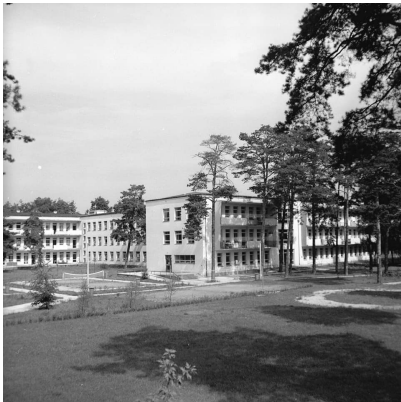
Stocer w 1967 r.

Rozpoczyna się wieloletni okres budowania bazy rehabilitacyjnej, leczniczej, naukowej, dydaktycznej i produkcyjnej. W 1963 r. zostaje oddany do użytku nowoczesny budynek szpitala, basen rehabilitacyjny, warsztaty ortopedyczne i pracownie diagnostyczne. W 1965 r. powstaje w szpitalu pierwszy w Polsce 42-łóżkowy oddział dla pacjentów z urazami rdzenia kręgowego. W 1973 r. w oddalonych o 4 km Chylicach powstaje Ośrodek Szkolno-Wychowawczy. Jest to szpital z oddziałami dziecięcymi dla blisko 200 pacjentów ze schorzeniami narządów ruchu. Szpital niezależnie od funkcji medycznej przystosowany jest do prowadzenia nauki na poziomie szkoły podstawowej i średniej oraz warsztatów szkolnych.