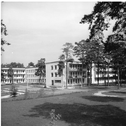
Stocer w 1967 r.

Rozpoczyna się wieloletni okres budowania bazy rehabilitacyjnej, leczniczej, naukowej, dydaktycznej i produkcyjnej. W 1963 r. zostaje oddany do użytku nowoczesny budynek szpitala, basen rehabilitacyjny, warsztaty ortopedyczne i pracownie diagnostyczne. W 1965 r. powstaje w szpitalu pierwszy w Polsce 42-łóżkowy oddział dla pacjentów z urazami rdzenia kręgowego. W 1973 r. w oddalonych o 4 km Chylicach powstaje Ośrodek Szkolno-Wychowawczy. Jest to szpital z oddziałami dziecięcymi dla blisko 200 pacjentów ze schorzeniami narządów ruchu. Szpital niezależnie od funkcji medycznej przystosowany jest do prowadzenia nauki na poziomie szkoły podstawowej i średniej oraz warsztatów szkolnych.