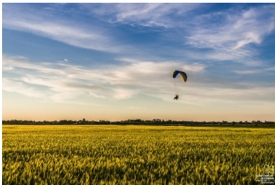
Rezerwat Olszyna Łyczyńska

Wielkim bogactwem Konstancina-Jeziorny są okoliczne rezerваты przyrody i lasy, dzięki którym powietrze jest tutaj nad wyraz czyste i przesycone eterycznymi olejkami. Ozdobę krajobrazu stanowi Wisła. Królowa polskich rzek rozlewa się bowiem u południowych bram stolicy szeroko na kilometr. Nadwiślańska część gminy przynależy do Urzecza - gwarowo nazywanego Łurzycem - niezwykle barwnego regionu etnograficznego rozciągającego się po obu brzegach Wisły, pomiędzy dawnymi ujściami Pilicy i Wilgi a mokotowskimi Siekierkami i prawobrzeżną Saską Kępą. Konstancin-Jeziorna i okolice, ze względu na bogactwo flory i fauny, są rajem dla miłośników dzikiej przyrody. Specjaliści podają, że w ciągu całego roku można tu zobaczyć ok. 150 gatunków ptaków.