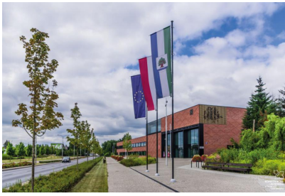
Urząd Miasta i Gminy