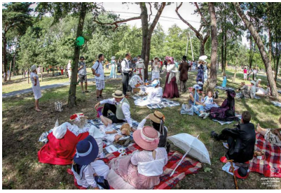
Dni Konstancina – piknik retro