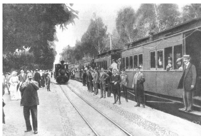
Stacja kolejki – 1916 r.